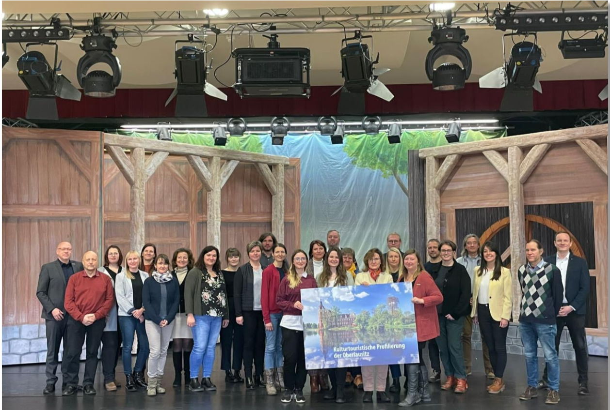
Gruppenbild auf der Bühne des SNE – 07.12.2022

Die MGO bedankt sich bei allen Partnern für die bisherige Zusammenarbeit und freut sich auf den künftigen intensiven Austausch.